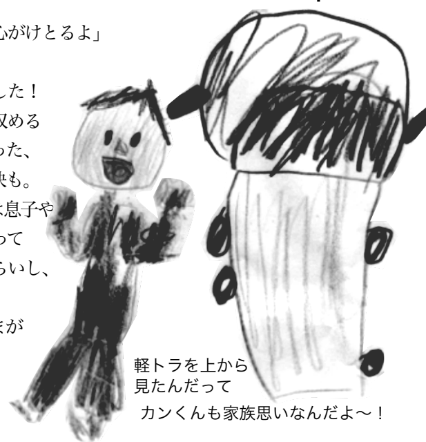
軽トラを上から 見たんだって

あつという間に12月！楽しい忘年会の季節ですね！ 郷蔵米生産者の忘年会は先月22日に行いました！ 去年から恒例化しようとしているこの日なんの日シリーズ！ 忘年会のその日に因んだテーマでインタビュー！ 皆さんご存知、11月22日は「いい夫婦の日」です！ 夫婦円満の秘訣を聞きました〜。